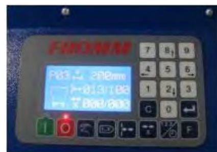
Ľahko ovládateľný riadiaci panel

Napájanie: 115 / 230V - 50 / 60Hz Veľkosti vankúšov: 120 – 400 mm programovateľné Šírka filmu: 210 mm Hrúbka filmu: 25my - 50my Kvalita filmu: PE nízkej a vysokej hustoty Zložený film / nie rolky