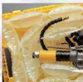
nepotrebný vnútorný obal