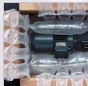
nekompromisné fixovanie (výrobku)