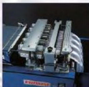
tlak vzduchu –zvary – perforácia