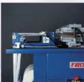
2 pásy fólie